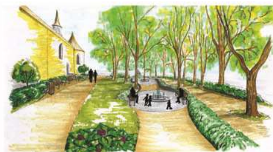
Situace Sadů Sv. Čecha: