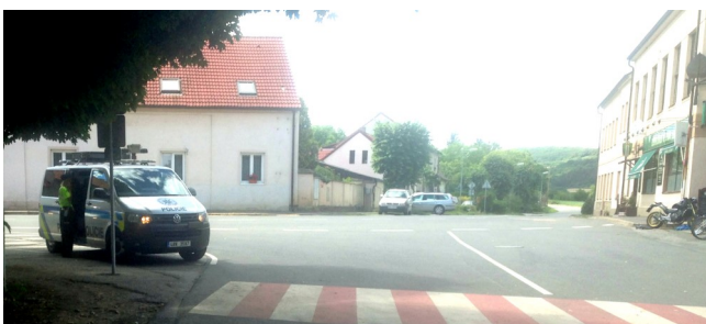
Motocykl a osobní auto před restaurací U lípy – vážná nehoda s několika zraněnými 1. července.

Dokončili jsme instalaci radarů, kterou jsme odsouhlasili před dvěma lety pro zvýšení bezpečnosti našich občanů.