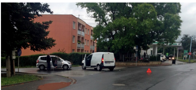
Dvě osobní auta – křižovatka před kinem, směrem do ulice Jana Bašty 26. června.