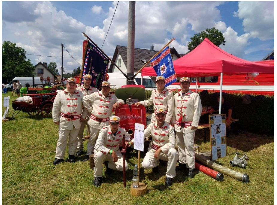
Liteňští hasiči ve Vrančicích, kde vybojovali skvělé umístění se stříkačkou z roku 1935.