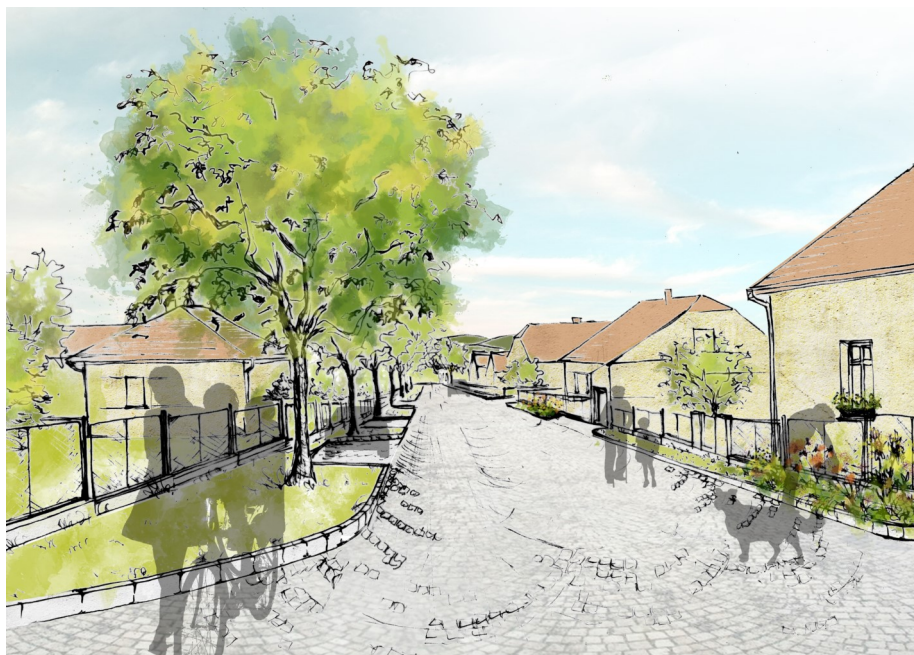
Vizualizace ulice po rekonstrukci, na které spolupracujeme s architekty.

Účasti na opravě Chrástecké ulice. Dohoda je vyjednána, smlouva je již od advokátů obou stran hotová a zbývá doladit poslední podrobnosti. Investor se zaváže poskytnout na opravu Chrástecké 800.000 Kč. Před námi je ještě kolečko, kterým musí smlouva projít v zastupitelstvu, a odsouhlasení na zasedání zastupitelstva.