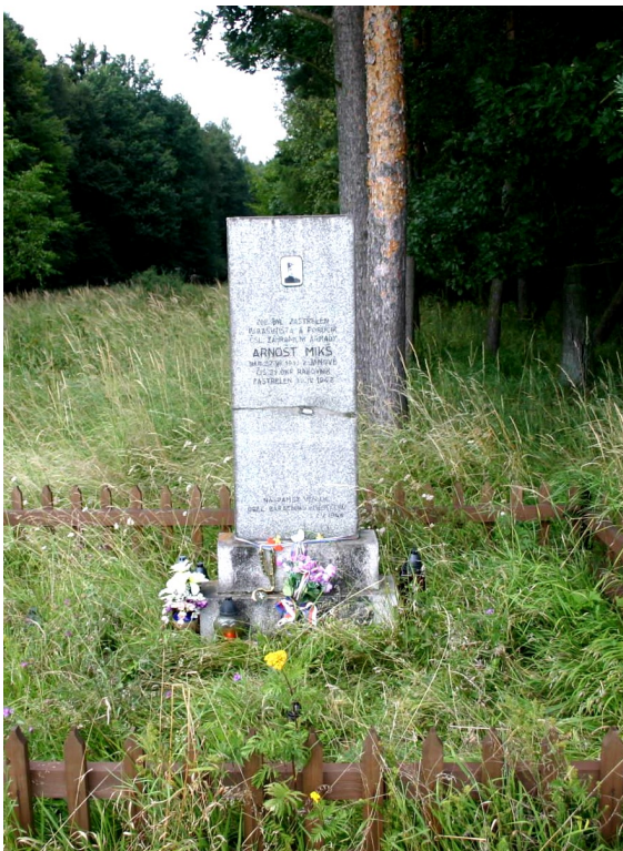
Pomník se nachází asi 20 metrů od místa přestřelky.