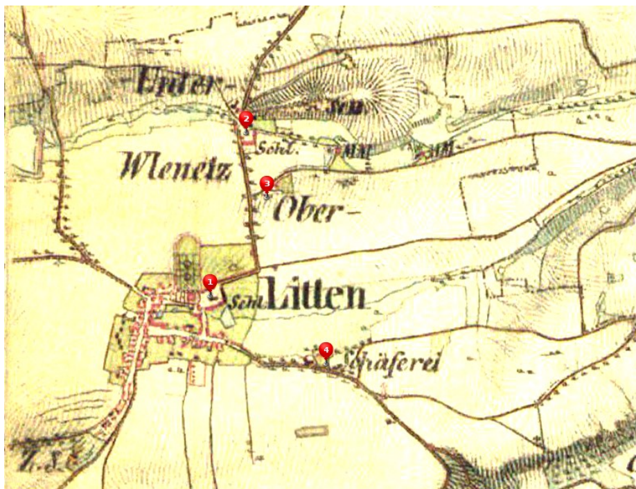
Gotické tvrze v okolí Litně.