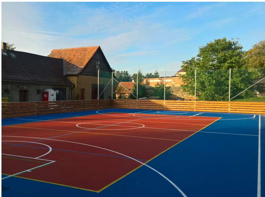
Nové multifunkční hřiště v Bělči.

Na hřišti si mohou zájemci zahrát fotbal, volejbal, nohejbal, přehazovanou, florbal a basket. Montáž basketbalových košů proběhne v druhé polovině října. Na stavbu hřiště jsme získali dotaci téměř 1,2 milionu. Připravená je architektonická studie na rekonstrukci budovy klubovny, kde vznikne zázemí pro hřiště se šatnami a společenská místnost s kuchyňkou a prostory pro aktivní odpočinek dětí, mládeže i seniorů. Všichni jste srdečně zváni!