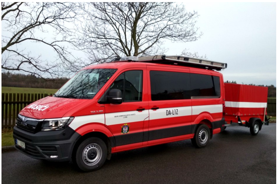
Nové dopravní vozidlo MAN TGE s přívěsem.

Naše jednotka si dodala vlastní vysílačky, vozidlovou Motorolu GM 360 a ruční HYT TC 700, další vybavení v základní kategorii dopravního automobilu L1Z bylo součástí zakázky. Vozidlo bylo dodáno s devíti sedadly, odnímatelnou přepážkou od nákladového prostoru, oranžovou světelnou aletí, střešním nosičem, tažným zařízením, práškovým a sněhovým hasicím přístrojem, zdravotnickým batohem, vyprošťovacím nástrojem Hooligan, vytyčovací páskou, zdravotnickými rukavicemi, dvěma rozbíječi oken s řezáky pásů, požárním nákladním přívěsem s plachtou, výjezdovým tabletem Lenovo, do kterého bude nahrána licence Rescue navigátor, dvěma svítilnami Survivor LED atex do výbušného prostředí, nezávislým topením o výkonu 4 Kw, kovovým krytem motoru, klimatizací, dvěma posuvnými dveřmi, zatmavenými okny. Vozidlo bude do-