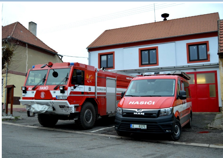
Liteňští hasiči mají důvod k oslavám. K nové cisterně TATRA 815/7 přibylo dopravní vozidlo MAN TGE. Více v článku na straně 3.