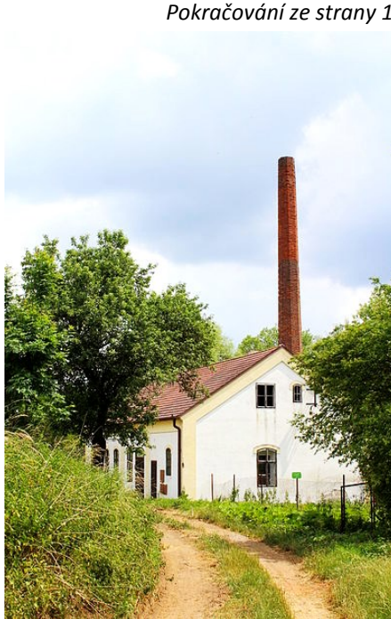
Pokračování ze strany 1

Už teď pracujeme na další fázi zkvalitnění naší vodohospodářské infrastruktury. V plánu je stavba vodojemu v Leči, posílení zdroje tamtéž a propojení s vlenceckou vodárnou. V Bělči jsou vytipovány tři větve na rozšíření vodovodního řádu: směr Vlence, směr Vatiny, směr Karlštejn. V roce 2018 jsme také kompletně zmapovali vodo-