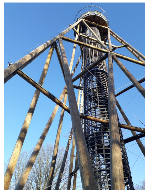
Rozhledna Máminka.

A na závěr trocha teorie. Běžně jsou používány vodoměry v bytech, kde nepřesnosti vznikají, jednak v důsledku povolené tolerance měřidla Q3 a Q2 (qp a qt), \pm 4\% a Q1 (qmin) \pm 10\% , jak uvádím výše, a dále nepřesností měřených hodnot ve spodním měřícím rozsahu od minimálního průtoku Q1 (qmin) až po nulový průtok vodoměru, kdy odběr nedosahuje průtoku zajišťujícího správnost měření s tím, že množství vody indikované vodoměrem je v těchto průtocích menší než množství vody skutečně protečené.