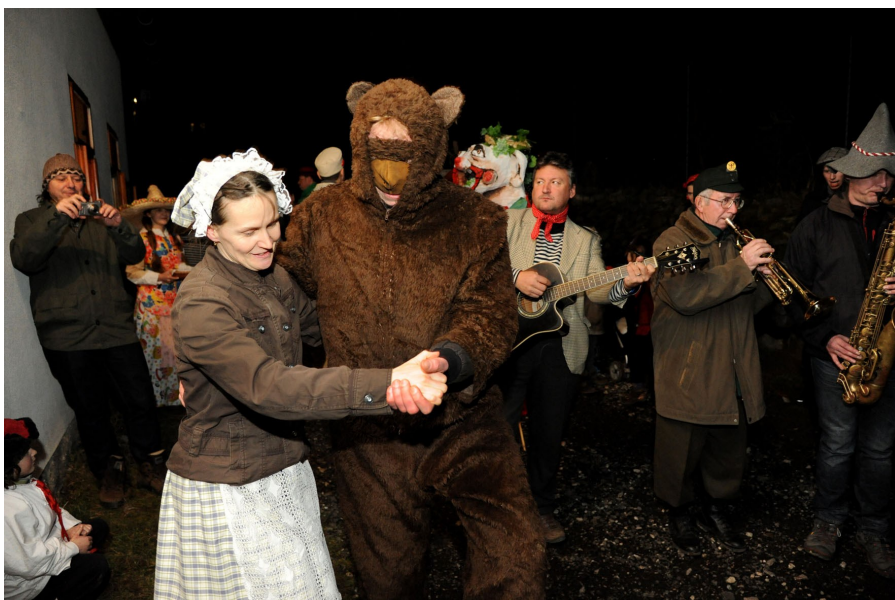
Masopust v roce 2016.

Srdečně zveme všechny na již 4. ročník Liteňského masopustu. Maškary projdou obcí za doprovodu kapely Der Šenster Gob a koňského spřežení ze Stáje Bílý kámen v pátek 1. března. Při sousedských zastaveních my maškary za malé pohoštění opáčíme tancem a zpěvem, hospodyně vezme do kola medvěď a hospodáře odměníme říkačkou.