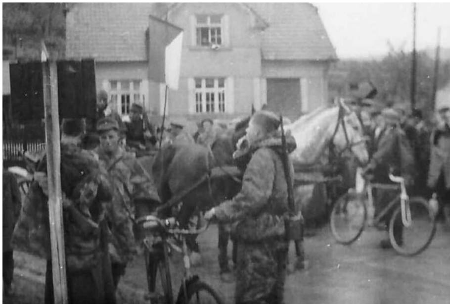
Vlasovci v Zadní Třebani.

Ve většině měst začaly na začátku května propuknout nepokoje, které vedly k celonárodnímu povstání. Tuto skutečnost si jasně uvědomoval i K. H. Frank, velitel SS a policie v Protektorátu Čechy a Morava. Naplno povstání propuklo 5. května. Povstalci se snažili o odzbrojování Němců, z pražských ulic mizely německé nápisy, vyvěšovaly se československé a spojenecké vlajky a rozhlas začal vysílat pouze v českém jazyce a