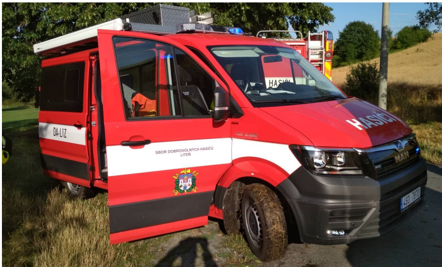
Vozidlo MAN TGE při zásahu u osoby visící na zídce. Časy: 17:23 vyhlášení poplachu / 17:26 výjezd / 17:30 příjezd / 18:22 odjezd / 18:23 základna .

Chvilku po návratu na základnu se siréna rozezněla opět. Jednotka vyjela s vozidlem MAN TGE k záchraně osoby visící na zídce za lýtko téměř ihned po nahlášení. Po příjezdu na místo hasiči zajistili stabilizaci zraněné ženy, která uklouzla na betonové zídce a při pádu se lýtkem nabodla na ocelovou závitovou tyč trčící ze zídky. Velitel jednotky informoval o situaci operační středisko a vzhledem k charakteru zranění rozhodl o stabilizaci a udržování osoby ve stávajícím stavu do příjezdu ZZS, jelikož byly důvodné obavy, že by po vytažení tyče z rány mohlo dojít k silnému krvácení. Žena po celou dobu plně komunikovala a hasiči ji uklidňovali. Po příjezdu profesionální jednotky z Řevnic a zdravotní záchranné služby jí byly podány léky a poté bylo zahájeno strižení ocelové tyče hydraulickým zařízením. Po vyproštění hasiči pomohli s transportem zraněné do vozidla záchranné služby a po úklidu použitého materiálu se jed-