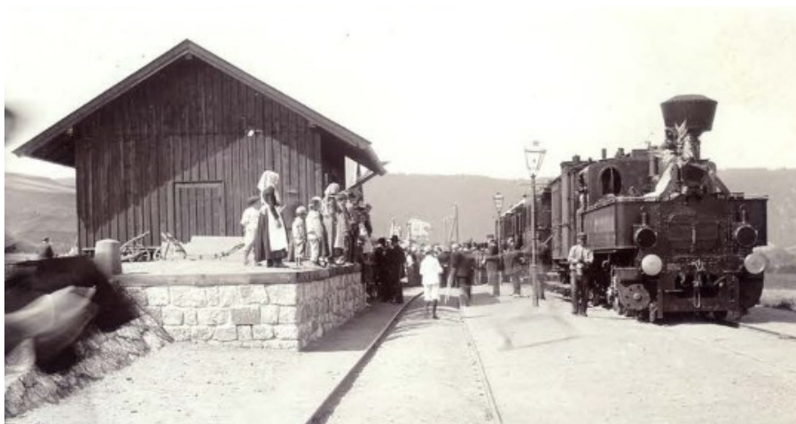
Slavnostní vlak při zahájení provozu na trati s lokomotivou 197.93 v Hostomicích