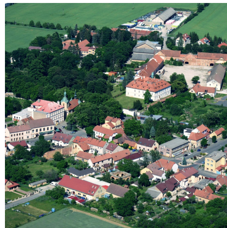
Liteň z ptačího pohledu. Více snímků najdete na www.mestyliten.cz

Zastupitelé také souhlasili s vytvořením pracovní pozice s názvem „Správce budov“ a zároveň se zrušením pracovní