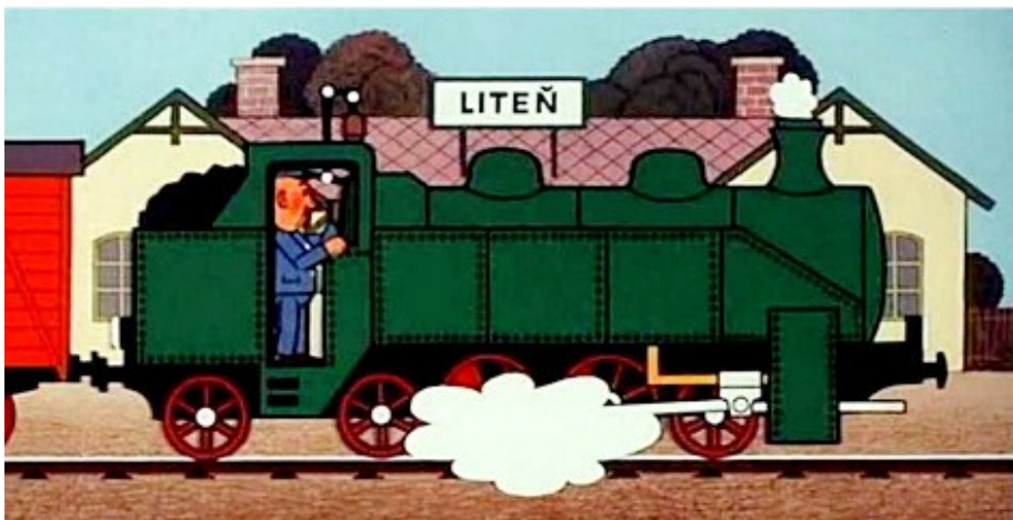
Pohádka o mašinkách připomíná parní lokomotivy i to, že okolí Litně bylo významnou bramborářskou oblastí.