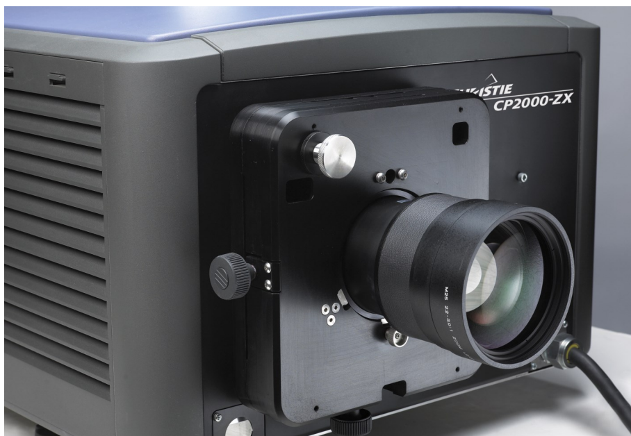
Nový projektor, který umožňuje promítání premiérových filmů v Litni.

Vzhledem k tomu, že Poslanecká sněmovna přijala 15. října 2019 návrh zákona, kterým se mění zákon č. 565/1990 Sb., o místních poplatcích, bylo nutné aktualizovat obecně závazné vyhlášky o místním poplatku z pobytu (poplatek činí 20 Kč za každý započatý den pobytu, s výjimkou dne jeho počátku), o místním poplatku ze psů (poplatek činí 100 Kč za jednoho psa na kalendářní rok, 200 Kč za druhého a