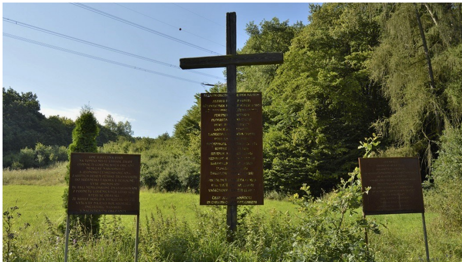
Památník masakru U Zabitého s jmény 19 obětí u silnice z Berouna do obce Vráž.

Příkladem nenávisti vůči Němcům v našem okolí je událost z 8. 5. 1945. Toho dne bylo mezi Berounem a Vráží v místě, kde se říká U Zabitého, povražděno Revolučními gardami a výrostky z Vráže 18 Němců a jeden Čech z Loděnic a Svatého Jána, kteří byli na cestě do internačního tábora v Berouně. Byl zřízen v budově obchodní akademie a internováno v něm bylo asi 1 200 osob včetně dětí, po prověření klesl jejich počet na polovinu. V červenci 1945 se asi 500 Němců přesunulo do bývalé sladovny ve Skuhrově a v listopadu 1945 do Poučnicku (dnes součást Karlštejna), kde panovaly velmi tvrdé pod-