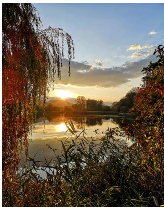
Snímek z Obory Martina Pecánka se umístil v naší fotosoutěži na druhém místě se 46 lajkami.