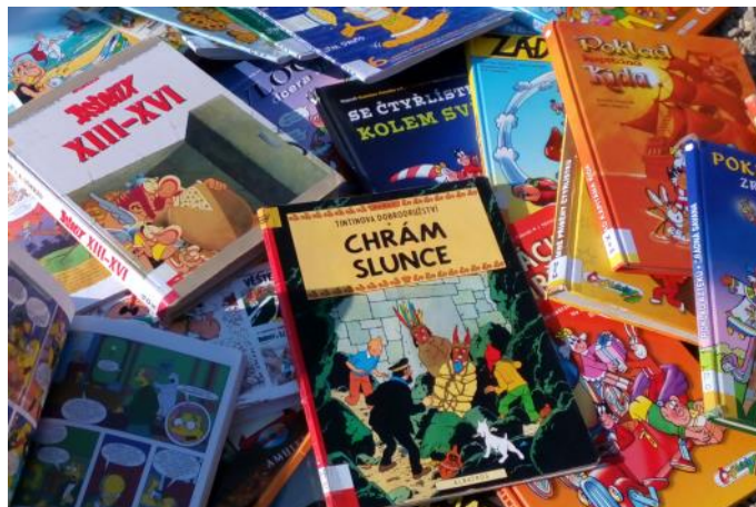
Ukázka z nabídky našich komiksů.

Jinak je knihovna pravidelně otevřena v pondělí a středu od 10 do 12 hodin a od 14 do 17 hodin. Zápůjčka knih je na měsíc a čtenářský poplatek platí na kalendářní rok (pro děti do 6 let a důchodci nad 75 let zdarma, děti do 15 let 50 Kč,