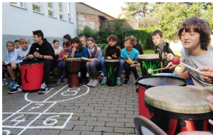
Bubnování před školou.