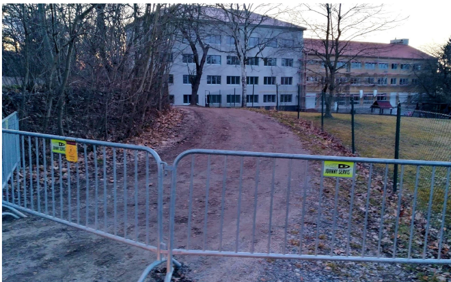
První reakcí ze strany developera na odpor městyse proti dělení zahrady bylo roz-místění zátarasů na příchodu ke školce.

I tak poslal městys připomínky, jimiž se developer zcela zjevně nezabýval. Místo toho developer opět mění názor (už počtvrté za tři a čtvrt roku) a v dubnu 2021 posílá zpět upravenou smlouvu ze září 2019. Mezitím developer požádal na počátku roku 2021 na Odboru územního plánování na MěÚ Beroun o stanovisko k rozdělení zahrady školky. Tento jeho záměr byl MěÚ minimálně jedenkrát odmítnut. Naneštěstí 26. února 2021 vydává MěÚ Beroun souhlasné stanovisko. Z návrhu se při té příležitosti dovídáme, že developer má v plánu stavět svoji vlastní soukromou školku.