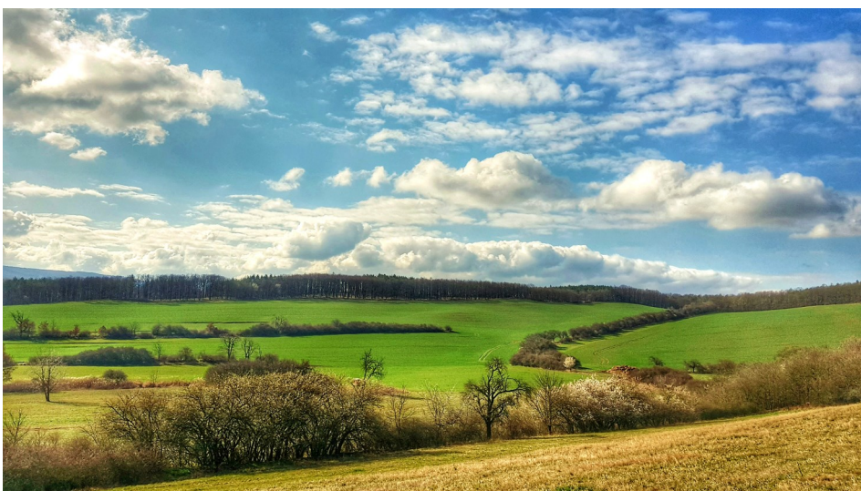
Fotografii z cesty na Mramor nás poslal Adam Simandel . Děkujeme!

Posílejte nám tipy na osoby aktivní v naší komunitě (například vedoucí kroužku, vedoucí tábora, organizátor různých akcí v obci, učitel, maratonec, horolezec, potápěč, jeskyňář atp.) a na místní podnikatele, kteří provozují zajímavou živnost, o nichž by napsal Berounský deník. Svě tipy posílejte emailem na adresu zpravodaj@mestysliten.cz . Děkujeme!