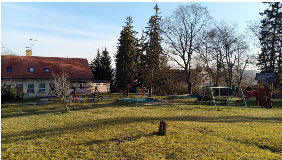
Tuto část zahrady chce developer oddělit a vykácat. Děti tak přijdou o zahradu a herní prvky.

Po doručení všech požadovaných dokladů, výše zmíněným způsobem,