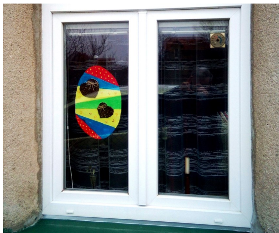
Kraslice od pana Iva Štastného. Děkujeme!

Celkem jsme v Lini vyrobili 331 kraslic různých druhů, velikostí a materiálů. Titul Velikonoční Kraslicov 2021 získala obec Věckovice na Plzeňsku a my se tímto připojujeme ke gratulaci! A děkujeme všem, kteří se u nás do výzvy zapojili.