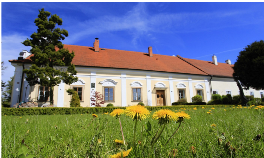
Čechovna v současnosti.

Do Litně přijela Jarmila Novotná poprvé před Vánoci onoho roku 1926. „Bylo to asi 50 km od Prahy v krásné krajině, obklopeno lesy, rybníky, na velmi plodné půdě,“ napsala. Natrvalo se do Litně přistěhovala po svatbě, která se konala 16. července 1931 v Praze na Malé Straně v kostele Panny Marie pod řetězem.