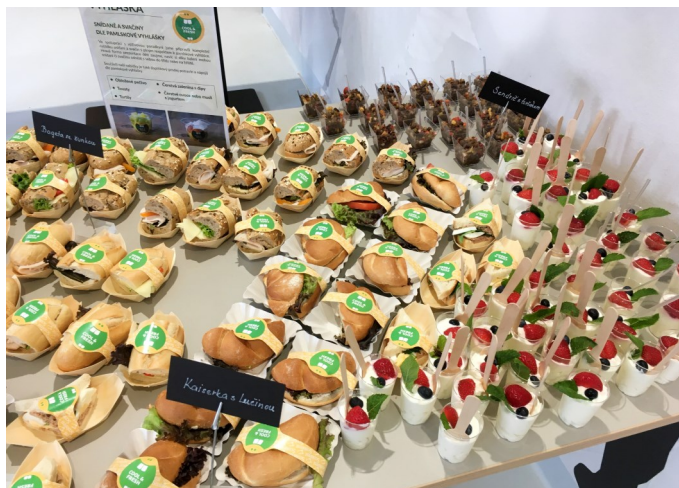
Návštěvníci mohli ochutnat svačiny, které ve škole připravuje společnost Scolarest.

Následně se návštěvníci přesunuli do budovy „C“, kde po prohlídce gymnastického sálu (28x15m), ve kterém lze vedle tréninku gymnastiky hrát basketbal, volejbal, nohejbal a badminton, ukázal pan starosta chloubu celého sportovního komplexu, a to sportovní halu s rozměrem sportovní plochy 32x19 m. Původně byla uvažovaná hala o rozměru 42x22 m s galerií pro diváky. Díky omezením prostorovým a finančním došlo v průběhu plánování ke zmenšení haly. Hala je připravena pro volejbal, nohejbal a basketbal. Na zmenšeném hřišti je nalajnovaná i házená a futsal a připravuje se rozšíření na tenis, který bude mít zkrácené zadní výběhy. K vidění byla také sauna a posilovna, které vznikly v suterénu původních výrobních hal. Zatím jsou ještě nevybavené, s nákupem posilovačích strojů a nábytku do sauny městys počítá podle finančních možností rozpočtu buď letos na konci roku, nebo vyčlení finance v rozpočtu pro rok 2022. Sauna i posilovna budou stejně jako sportoviště přístupné veřejnosti. Na úplném konci pak měli návštěvníci možnost nahlédnout do prostor, kde bude působit masérka Jiřina Benešová (kontakt pro zájemce je muj.e-mail@seznam.cz). Součástí budovy „C“ je také pět šaten a kabinet/místnost pro trenéry. Novou školní kuchyni a jídelnu, venkovní hřiště a prostory budovy „C“ no-