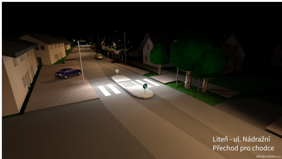
Vizualizace osvětlení Liteň, kterou předvedla na zasedání firma SATHEA VISION.

• KoPU z pohledu ML absolutně neřeší větrnou erozi, ale řeší pouze vodní erozi. A to stejně jen neúplně, protože část vody, přes všechna opatření, bude přivedena do Bělče, což zastupitelé odmítají stejně jako vyjádření společnosti Azimut, že to není jejich starost