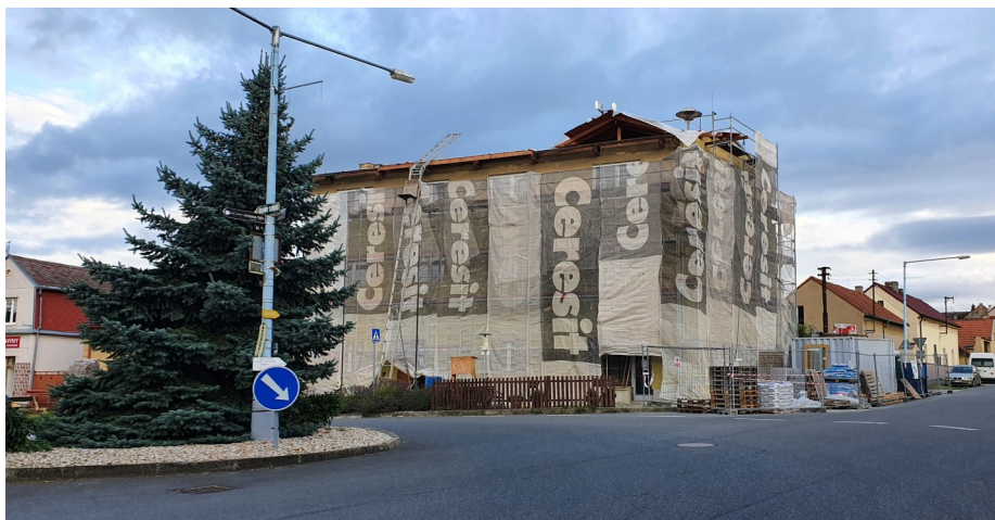
Rekonstrukci radnice prodlužuje nedostatek stavebního materiálu a generální dodavatel, nikoli neuhrazené faktury.

• žádost o výměnu ulic (staveb, nikoli pozemků) Pode Zděmi (stavba/asfaltový povrch patří kraji, pozemky městysi) a Jana Bašty (stavba/asfaltový povrch patří městysi, pozemky patří ze 79 % kraji, zbylé 4 pozemky jiní vlastníci). Kvůli bezpečnému přechodu dětí do nového školního areálu jsme opravdu intenzivně začali řešit už v srpnu 2020 (ML s ní souhlasil již na jednom z veřejných zasedání v roce 2015). V září 2020 jsme zaslali žádost na Krajský úřad a správu silnic a pak jsme 8 měsíců (!!!) urogovali odpověď, kterou jsme obdrželi až poté, co jsme o pomoc požádali našeho regionálního senátora a odpovědného krajského radního. Odpovědný úředník z KSÚS, po téměř třičtvrtě roce