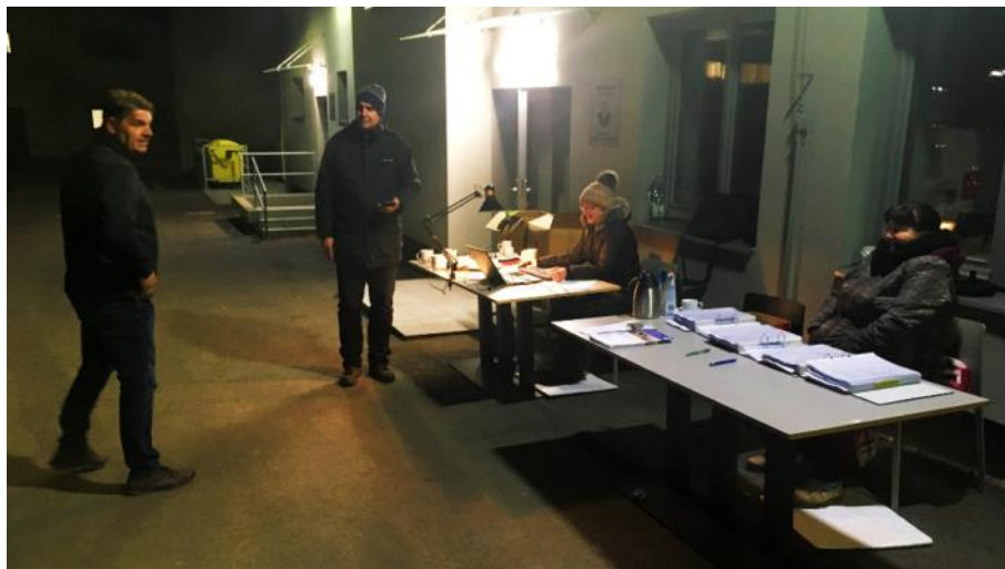
Výdej popelnic ve čtvrtek 25. listopadu To ještě nesněžilo...

Velká poklona a obrovské díky ale také všem občanům ML , kteří chápou, že se nejedná o změnu, s níž přišli zastupitelé ML, ale vyžaduje ji legislativa „shora“. Jsme upřímně potěšeni, že nový zákon o odpadech a s ním související možný extrémní nárůst poplatků za