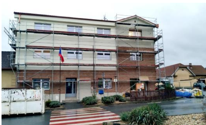
Nová podoba radnice se rýsuje.

Jako bonus jsme k opravě přidali výtah, který zajistí bezbariérový přístup pro hendikepované, starší či méně pohyblivé. V interiéru jsou osazena namísto žravých zářivek nová LED svítidla, díky nimž dosáhneme na více než 80 % úspory elektřiny. Což se zejména dnes, kdy každý den padají nové rekordy cen elektřiny, hodí. Když k zateplení a výměně svítí-