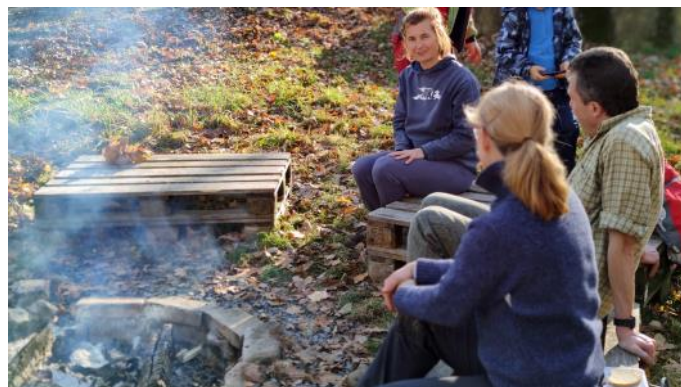
Opékání buřtů v areálu nové školy.

Víťa Novotný dopředu připravil díry pro stromy a přivezl nám kvalitní zeminu, paní Barthová z organizace Sázíme stromy nám udělala krátké školení, jak stromky správně zasadit, nůžkami upravit a zajistit proti okusu zvěří.