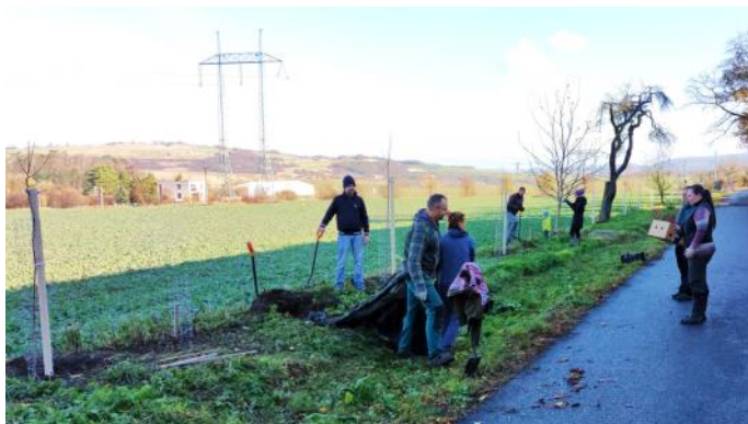
Ze staré aleje zůstalo již jen několik málo stromů.

První listopadovou sobotu jsme se sešli – přibližně desítka sousedů – u naší nové sportovní haly, abychom vysázeli celkem 40 stromů a 250 keřů. Počasí nám stejně jako vloni přálo, takže byla radost pracovat na čerstvém vzduchu.