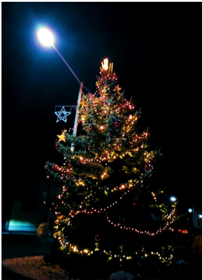
Rozsvěcení se konalo bez doprovodného programu první adventní neděli. Přijďte se podívat!

del připočteme výměnu kotle před 3 lety a pořízení regulace, zbývá osadit radiátory chytrými hlavicemi a integrovat je do systému regulace (ideálně přes internetové rozhraní). Spolu s úpravami elektroinstalace jsme udělali i rozvody strukturované kabeláže pro počítačovou síť. Nově máme hotové i inteligentní zálohování dat a zcela vážně uvažujeme o fotovoltaike. Jsme rádi, že budovu radnice nyní můžeme označit jako energeticky úspornou, reprezentativní a přívětivou pro návštěvníky.