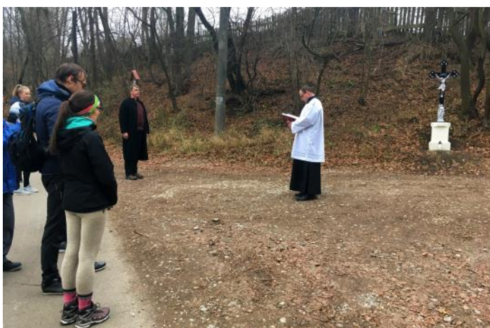
Kříž je symbolem věčné naděje.