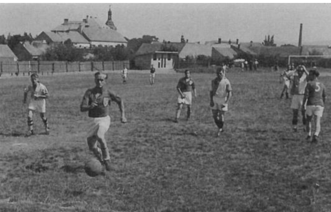
Smutné nejen sportovní období v době druhé světové války.

Druhá světová válka omezila a zasáhla do fotbalových soutěží. Sekretář Václav Klimt do kroniky uvedl, že veškeré zápasy pro stanné právo se dohrají na jaře. Dochovaly se výsledky mj. z roku 1942 se soupeři Hýskov 2:3, Mezouň 2:5, Zdice 7:1, Loděnice 4:0, Nižbor 2:13!