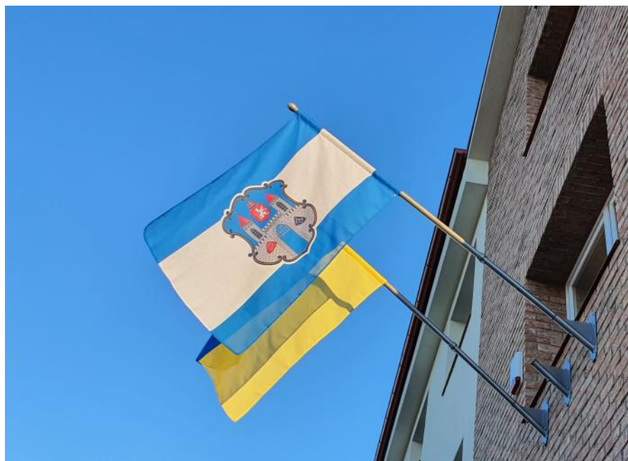
Ukrajinská vlajka na radnici na podporu Ukrajiny.

Tento text by se dal začít asi tisíci možnými způsoby, protože starostí s rekonstrukcí radnice bylo nebývale mnoho. Covidová krize a s ní související nedostatek materiálu, řemeslníků a dělníků, kteří se do Česka nemohli dostat kvůli restrikcím, všechny potíže umocnily. Co bych si však nepředstavil ani v nejdivočejším snu, je fakt, že budeme na novotou svítící radnici do nových držáků na žerdě vlajek jako první vyvěšovat vlajku cizího státu, v tomto případě vlajku Ukrajiny, která od 24. února čelí ruské vojenské agresi.