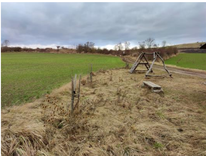
Začátek 350 metrů dlouhé aleje u pískovny v Bělčí.

Přes zimu jsme se stejně jako každý rok domlouvali s různými organizacemi, zda by nám mohli finančně pomoci s výsadbou v našich obcích.