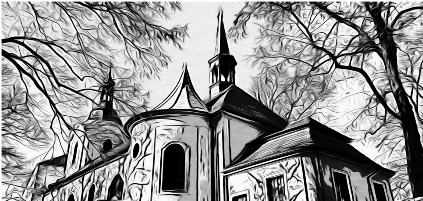
Kostel sv. Petra a Pavla