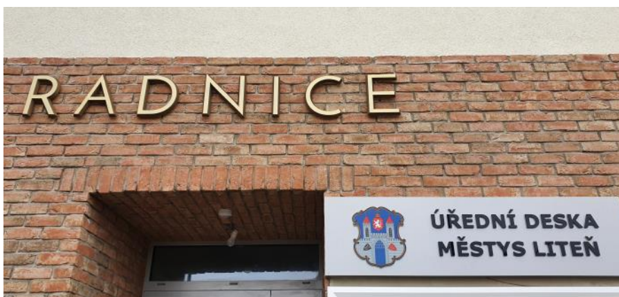
Nový nápis nad vchodem a nová úřední deska.

Připravujeme jednotlivé smlouvy, které musí schválit zastupitelstvo. V tomto ohledu to mají totalitní režimy a diktátoři jednodušší. Mohou reagovat okamžitě z pozice své absolutní moci. My musíme postupovat podle regulí, tedy s určitou časovou prodlevou. Prosím proto, budme trpěliví a táhněme za jeden provaz.