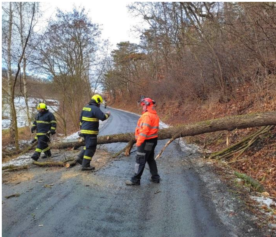
Liteňští hasiči zasahovali opět u několika větrem polámaných stromů na silnicích.