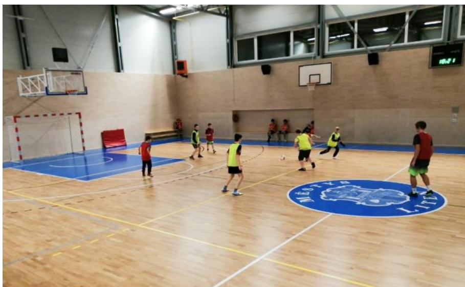
Zimní příprava v nové liteňské sportovní hale.

Nábor sportovně založených dětí z blízkého a širokého okolí pro kategorie starších žáků, mladších žáků a přípravek probíhá od konce března každé