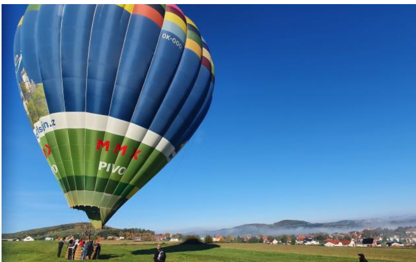
Přistání horkovzdušného balonu z Karlštejnu u Litně zachytil PhDr. Vladimír Kačer. Děkujeme za poskytnutí této i dalších krásných fotografií!