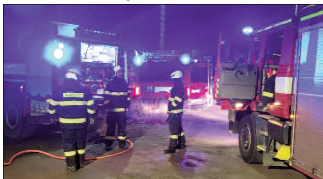
Liteňští hasiči při zásahu na místním nádraží.

V lednu hasiči měli i taktické cvičení. Využili vyhořelou budovu bažantnice, než ji na jaře myslivci strhnou, aby zde mohli postavit novou. Zorganizovali jsme cvičení a pozvali i jednotky z Karlštejna, Všeradic a Hlásné Třebaně. V zakouřené budo-