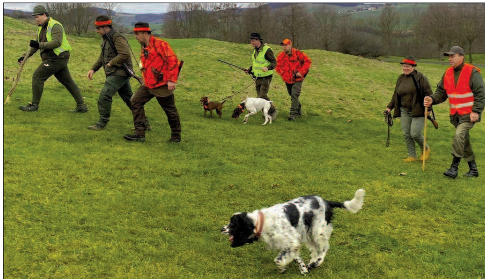
NA GOLFU. Liteňští myslivci a honci na společném lednovém lovu.

V sobotu 7. ledna se sešli liteňští myslivci, honci a hosté na posledním společném lovu mysliveckého roku 2022/23. Bylo plánováno lovit na golfovém hřišti a v jeho okolí, kde se objevují stopy po hodování divokých prasat. Neklamným znakem tzv. buchtování jsou otočené a rozházené drny trávy, pod nimiž divočáci hledají chutné červíky a další potravu. Když jsme ráno snídali ve Stínu lípy, mysleli jsme, že půjde o příjemnou procházku a po polední budeme doma. Bylo to naivní. Prasata na golfu byla velmi chytřá, což je u černé zvěře běžné, takže se přesunovala skrytě v houštinách a značným tempem. Jednomu z hostů málem skočil kňour do náruče a též psi měli co dělat, aby ve střetu s postřeleným divočákem nepřišli k úrazu. Lov byl ukončen v půl páté odpoledne, kdy se již začalo stmívat a na výřadu byla dvě ulovená prasata. (Dokončení na straně 8) (kk)