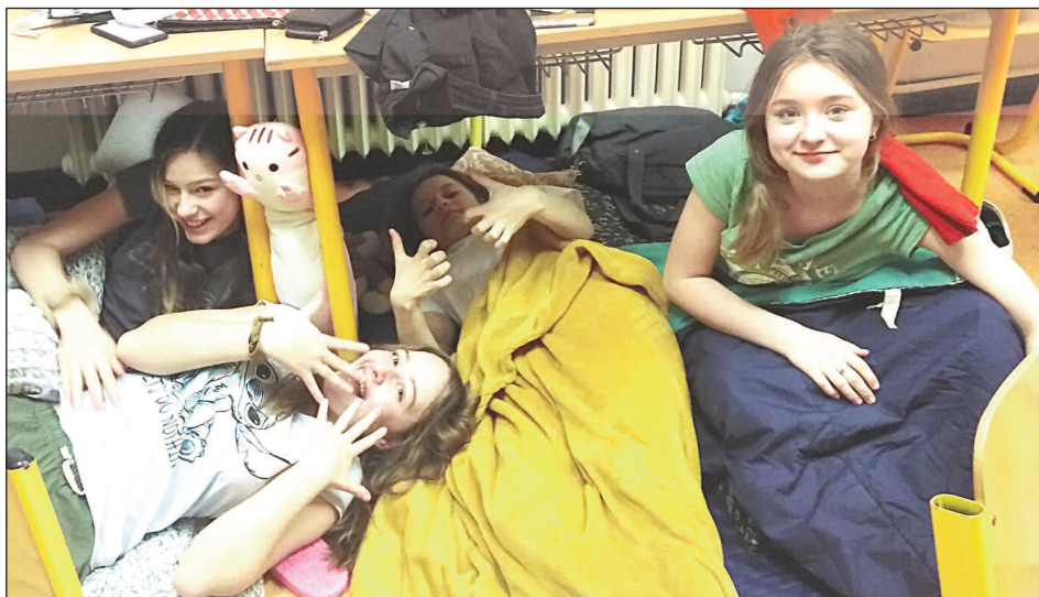
POD LAVICEMI. Žáci liteňské ZŠ nocující ve »svě« škole.

V liteňské ZŠ máme s tímto projektem dlouholetou zkušenost. Letos v obou budovách spalo více než 150 dětí z obou stupňů. Po páté hodině odpoledne se začali objevovat žáci vybaveni svačinou, spacákem a karimatkou, někteří si vzali i oblíbené plyšáky. Během večerních, u starších dětí i nočních a ranních hodin, se konaly různé organizované i spontánní aktivity. Užili jsme si společné čtení, tvoření, soutěže, kvízy. Prvníáci a druháci začali program besedou s ilustrátkou Dorou Dutkovou, která vyprávěla mj. o pravěkých malbách v jeskyních, rukopisech či vzniku knihtisku. (Dokončení na str. 8)