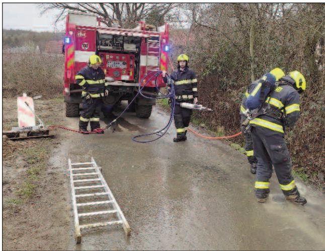
V HALOUNECH. Liteňští dobrovolní hasiči v březnu vyjžděli k poškozenému plynovému potrubí v Halounech.

Požár garáže v Karlštejně, ve které je uskladněná elektronika a kuřata, byl hasičům ohlášen 24. března odpoledne. Jednotka přijela k místu