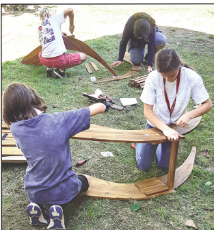
Děti při sestavování relaxačních lehátek.

Dokončením oprav chlapeckých záchodků a keramické a dřevorezbné dílny odstartovala soukromá Naše škola v Litni nový školní rok. Nové prostory můžete vidět v rámci Dne otevřených dveří 2. 11. od 8.35. Díky grantu Dobrý soused Nadačního fondu Tipsport pro podporu komunitního života na Berounsku jsme pro veřejnost nakoupili relaxační lehátka na školní zahradu. O jejich sestavení se postarali žáci 8. ročníku - naučili se tak pracovat s nářadím, precizností i spolupráci. Hned od první chvíle lehátka začali ve slunných dnech bohatě využívat jako státní i soukromé školy, stejně jako rodiče čekající na své ratolesti či při