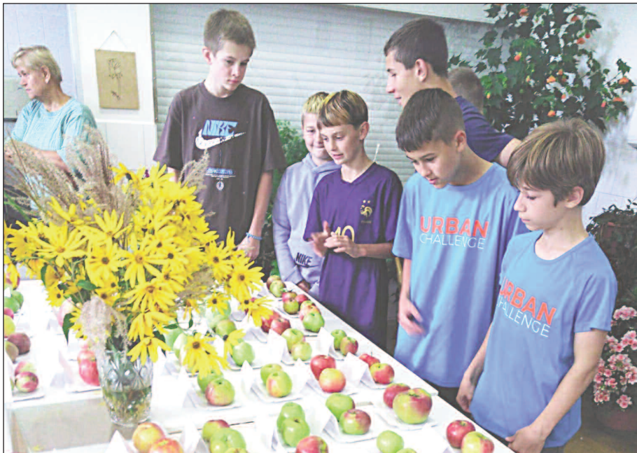
EXPONÁTY K NAKOUSNUTÍ. Liteňští školáci na zahrádkářské výstavě.