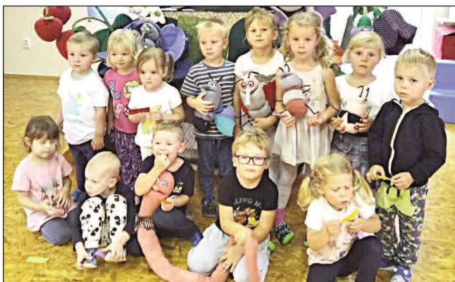
VE ŠKOLCE. Liteňští »školkáčci«.

Koncem srpna se v Mateřské škole Liteň konala informační přednáška. Rodiče se na ní dozvěděli o novém celoročním projektu Lokomoce - Pohyb do škol, do kterého se naše školka tento školní rok zapojila. Jak už název projektu napovídá, cílem je zapojovat do režimu dne v MŠ ještě více pohybových aktiv než tomu bylo doposud. Součástí je pravidelné proškolení pedagogického personálu odborníky formou tzv. workshopů a spolupráce s fyzioterapeuty. Jednotlivé workshopy se zaměřují na konkrétní části těla a správnost prováděných cviků. Součástí jsou i tipy na motivované námětové cvičení tak, aby děti zaujalo a bavilo. Přestože měsíc září se každoročně nese v poklidném duchu a zaměřuje-