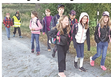
PĚŠKY. Děti z Korna na cestě do školy.

Projekt s názvem Pěšky do školy se letos konal již šestým. ZŠ Liteň se zapojila také - byli jsme zvědaví, co nám týden přinese a jak se k výzvě žáci i jejich rodiče postaví. Prvnáci vymysleli parafrazi na naše školní motto Škola, kam má smysl chodit a pod heslem Škola, kam se chodí pěšky tvořili v hodinách výtvarné výchovy, povídali si o výhodách chůze a zamýšleli se nad ochranou životního prostředí. V ostatních ročnících se žáci podle