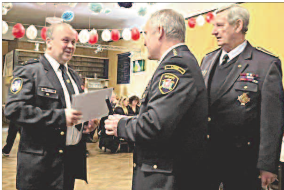
DĚKUJEME! Předávání ocenění na výroční valné hromadě liteňských hasičů.