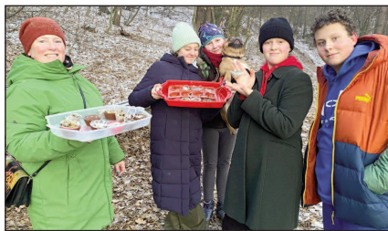
V LESE. Členové mysliveckého kroužku na lednové schůzce přikrmovali ptáky.

V sobotu 30. prosince se sešli liteňští myslivci a