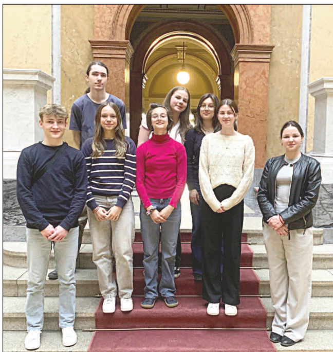
V RUDOLFINU. Řevnická výprava v pražském Rudolfinu během soustředění, které se konalo předposlední dubnový víkend.

V říjnu, lednu i únoru se už konaly společně dělené zkoušky (dech,