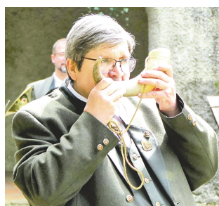
Vystoupení Českého trubačského sboru.

Hornové dny se v liteňském zámku konaly již počtvrté, poprvé s podtitulem Jarní akademie hornistů České filharmonie. Během víkendu bylo na programu šest koncertů, při masterclasses a workshopu si hornisté z celé České republiky předávali zkušenosti a zdokonalovali techniku. V nově zrekonstruované oranžerii si návštěvníci mohli prohlédnout výstavu žesťových nástrojů Brass Studia Prague včetně skvostných kousků lesních rohů. Nedělní koncert Českého trubačského sboru přilákal do parku mnoho diváků a stal se příjemnou tečkou za