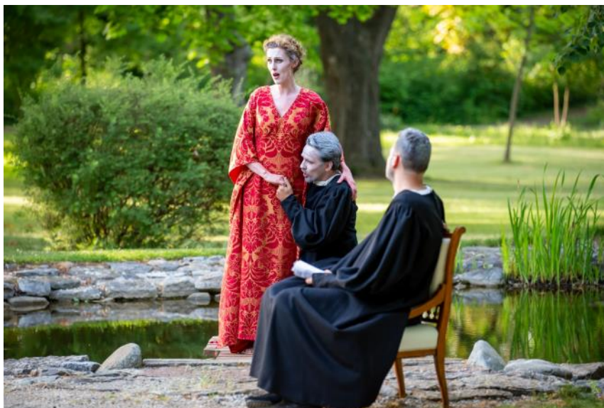
Počasi nezklamalo a příhodně dokreslilo efekt hudební produkce odehrávající se u jezírka v zámeckém parku.