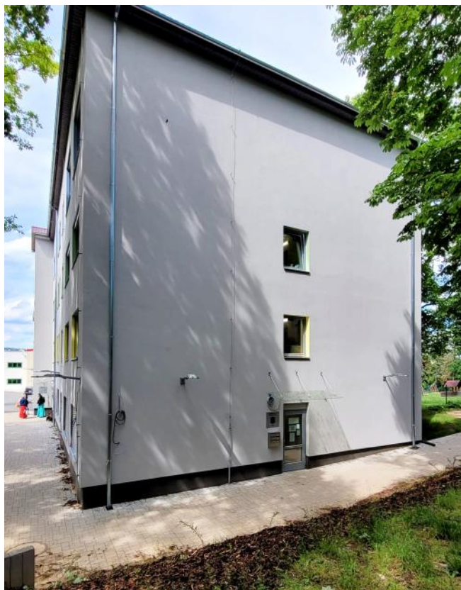
Ordinace se nacházejí z boku budovy A nového školního areálu v ulici Pode Zděmi.

Ordinaci dětské lékařky MUDr. Šebkové můžete kontaktovat na telefonním čísle 725 724 806 nebo emailem na adrese ordinace.sebkova@gmail.com . Veškeré informace včetně ordinací doby najdete na www.nasimiditkam.cz .