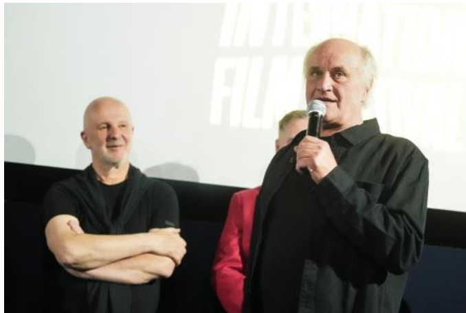
Michael Kocáb na premiéře filmu „Pražský výběr – Symphony Bizzare“ letos v květnu.