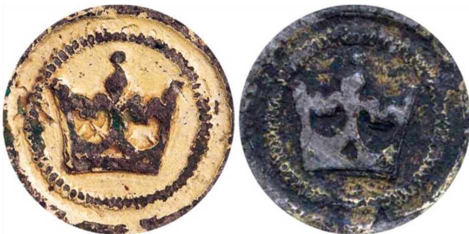
Obr. 2: Porovnání obrazu lva na mincovních závažích / etalonech z nálezu v Bělči (vlevo) a z Chaurovy sbírky, NM H5-14602 (vpravo).