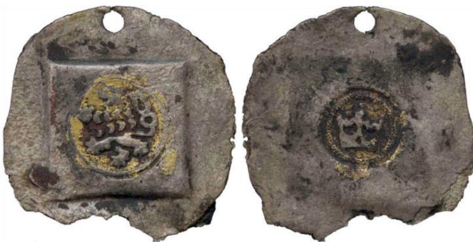
Obr. 1: Oboustranně ražené zlacené mincovní závaží / etalon z Chaurovy sbírky, NM H5-14602.

V případě využití jako mincovního závaží můžeme uvažovat o tom, že okrajová část mohla být ostříháním upravena na požadovanou váhu. Takto vytvořený artefakt nebyl vizuálně nijak zvláště estetický, aby mohl sloužit jako šperk či jiná ozdoba. Jeho tvar navíc neumožňuje jakékoli uchycení, nemá poutko ani dírkou na případné našití na oděv, nebo jeho součásti. Identický zlacený exemplář z Chaurovy sbírky (obr. 1) sice má ve své horní části perforaci, ta však byla zřejmě vytvořena až později neodborným zásahem, v jehož důsledku okraj střížku praskl.