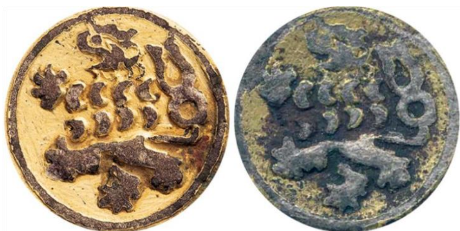
Obr. 3: Porovnání obrazu koruny na mincovních závažích / etalonech z nálezu v Bělči (vlevo) a z Chaurovy sbírky, NM H5-14602 (vpravo).