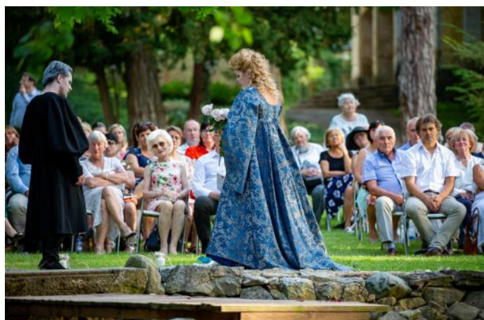
Publikum výkony pěvců Operního studia Slovenského národního divadla ocenilo.