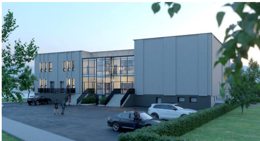
Vizualizace Společenského domu po rekonstrukci.

V posledních dvou bodech zastupitelé souhlasili s instalací regulace vytápění do nové sportovní haly a gymnastického sálu. Během topné sezóny totiž docházelo k neoprávněné manipulaci s nastavenou teplotou 18 °C, kdy v hale bylo i 27! °C. Následně docházelo ke snížení teploty otevřením oken a jejich neza-