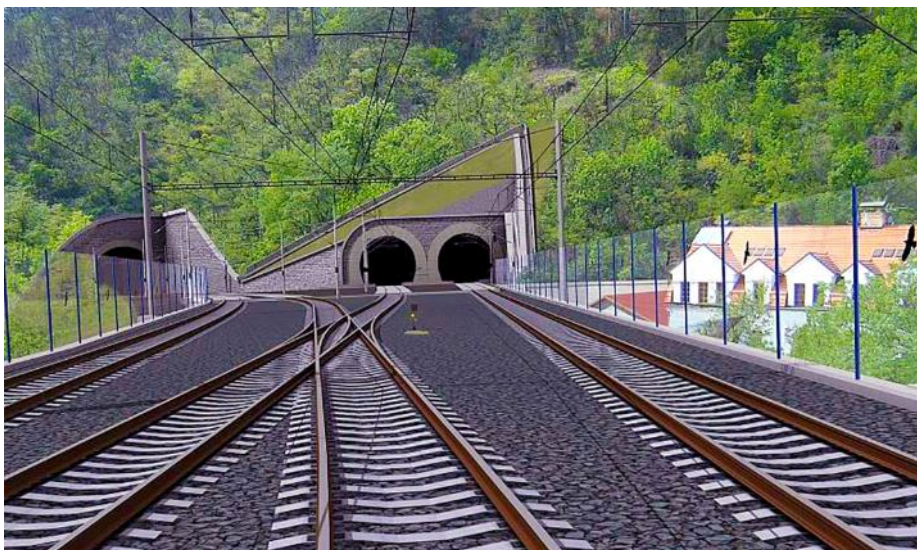
Portál tunelu na vjezdu z Branického mostu. Od Smíchova tunel ústí do skály pod Barrandovskou radiálou mezi tratěmi na Beroun a Rudnou. Tratě na sebe v tunelu naváží mimoúrovňovým křížením.